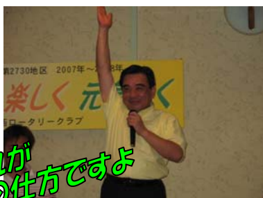
これが 正式な万歳の仕方ですよ