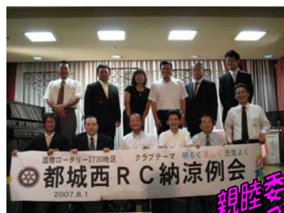
親睦委員会のみなさん ご苦労さまでした