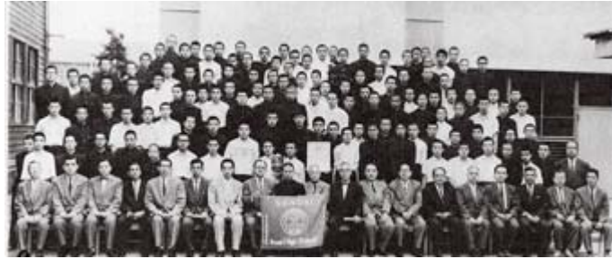
仙台育英学園高校IACの創立総会は、 1963年6月27日、盛大に行われました

インターアクトクラブ(Interact Club、IAC)とは、奉仕と国際理解に貢献する青少年のための、ロータリークラブ(RC)提唱の世界的団体で、高校に在学中の生徒、または年齢14～18歳までの青少年が入会できます。Interactという名は「国際的活動」International Actionを意味します。