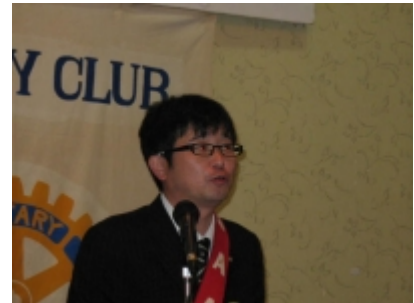
S A A 鳥集会員