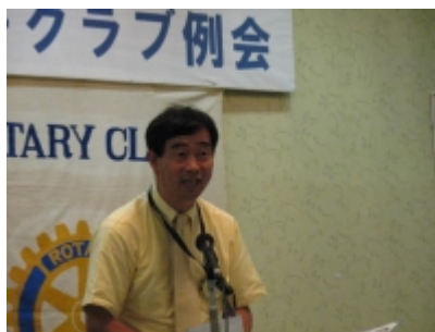
プログラム 吉原委員長