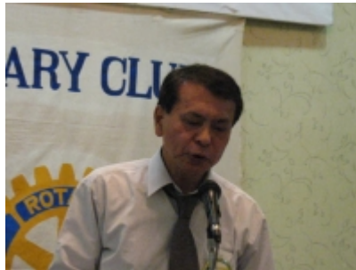
社会奉仕 大峯委員長