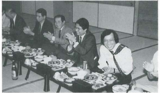
参加者全員で祝福…鎌田会員…本当におめでとうと