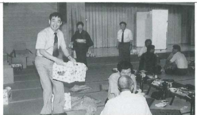
スマイル・スマイル長友会員大サービス中なり