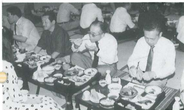
「ヤッパリ」温泉の食卓は味も格別な森川会員の手に御注意