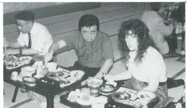
箸の使い方は…上手になったねえ〜とお父さんが…… 国際交流の「箸渡し」となる…ヨカコツジャア〜