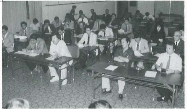
後方が静かだった例会場(国際観光ホテル)で