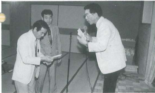
今月この会場で御祝を頂く倅せな御二人さん