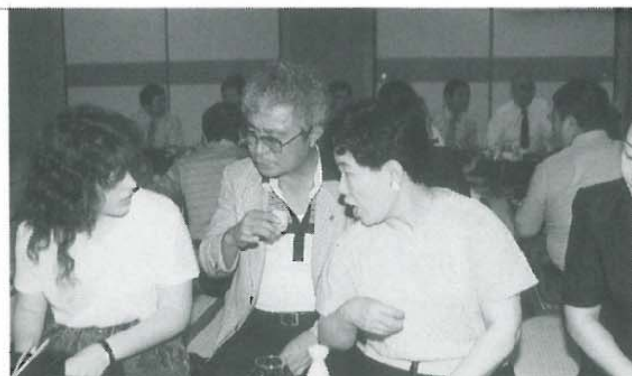
国際級の語学?河中会員おおいに語る