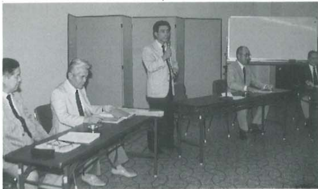
皆様の御協力が無事、大役をはたしましたと会長の 熱弁…満足な顔…ごくろうさまでしたねこの1年間