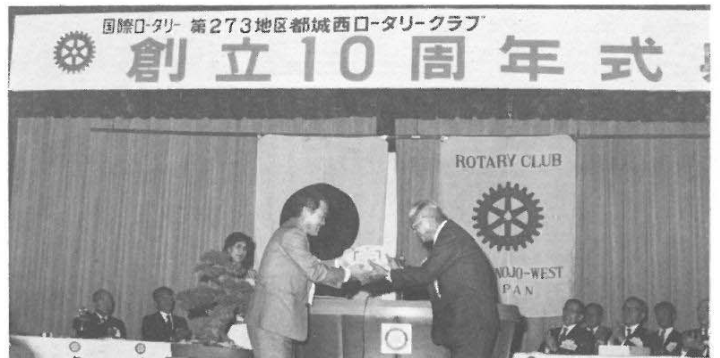
姉妹クラブ 東蔚山ロータリークラブより記念品の贈呈