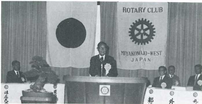
外山ガバナー御挨拶