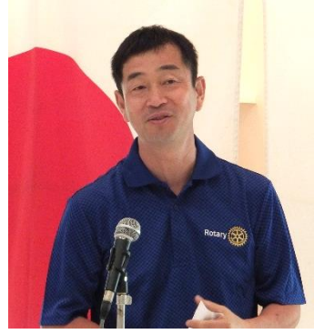
吉原 会長より挨拶