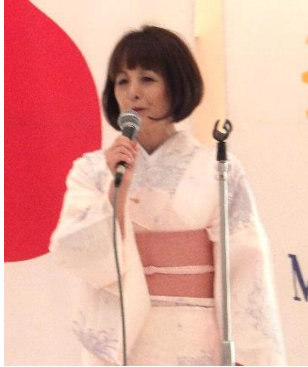
中原 親睦委員長より挨拶