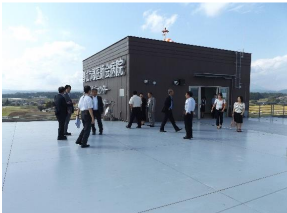
ヘリポートにも案内していただきました