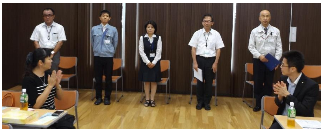
健康サービスセンターの方々 今日はよろしくお願いします