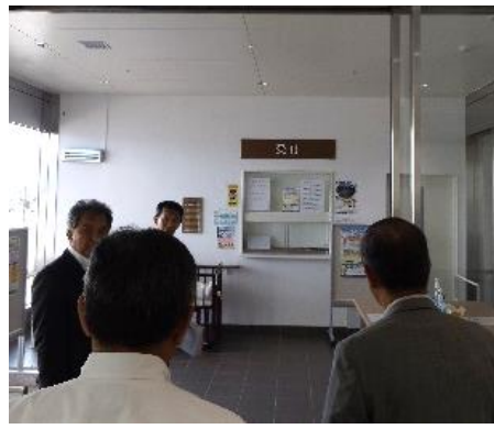
夜間病棟や救急隊入口、検査室などを見学しました