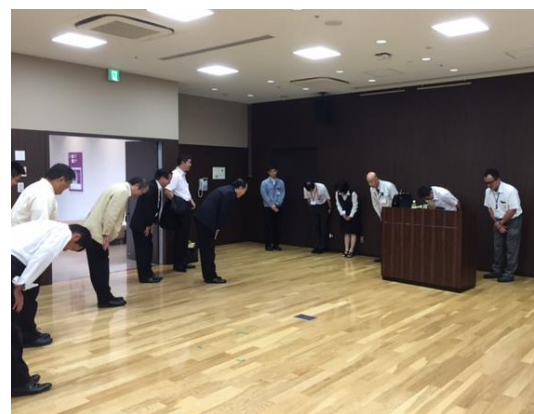
貴重な体験が出来ました(*^_^*)