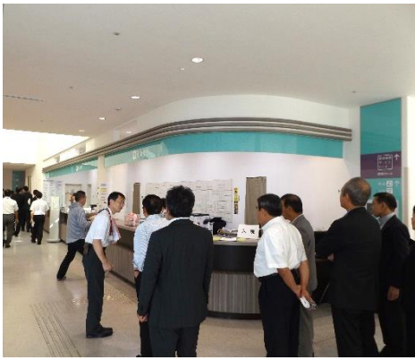
いよいよ 館内見学です