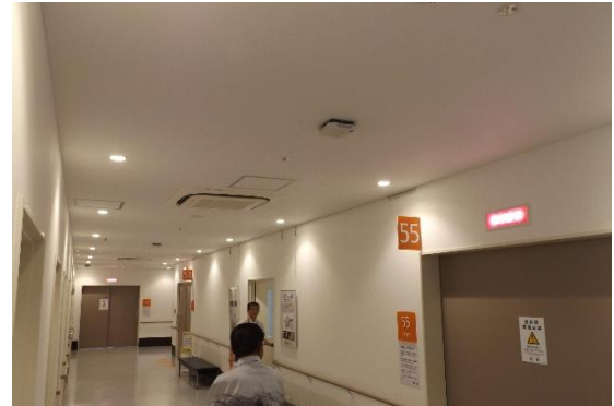
最新の設備に目が釘づけです