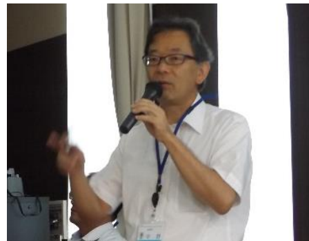
DVD 映像にて、施設の説明をしていただきました