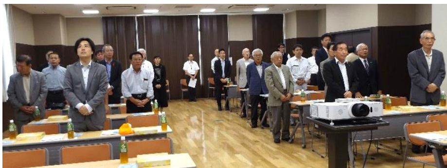
研修ホールにて例会を行いました。