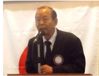
ロータリー財団寄付の件