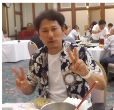
国際大会 初参加でした♪