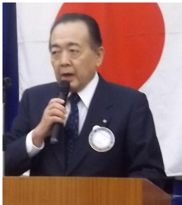
小坂会長 あいさつ