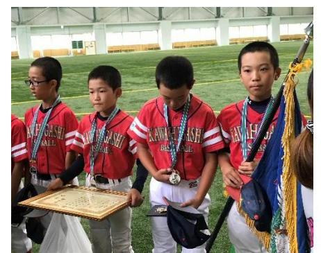
準優勝 川東ベースボール