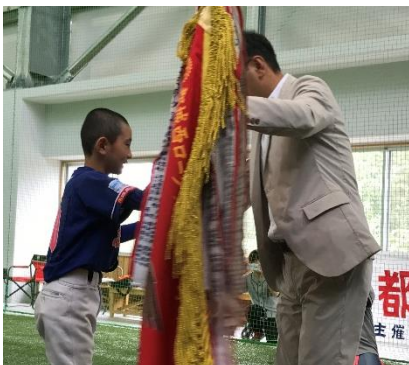
優勝 志比田スポーツ